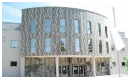
VHOD V ŠPORTNO DVORANO