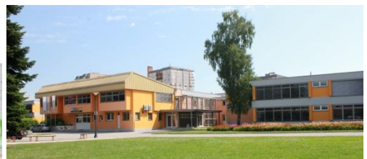
OSNOVNA ŠOLA BREŽICE

Parkirni prostor za kombije je za dvorano na Černelčevi cesti 10.